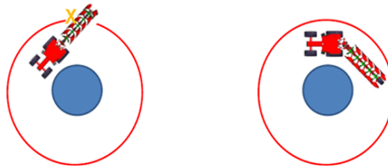
Kverneland 2500 i-Plough® position transport

“La charrue suit le tracteur comme une remorque suit une voiture. C’est une solution très sûre pendant le transport. Ce concept simple nécessite des solutions innovantes telles qu’une tête d’attelage pivotante désaccouplable, sans lien supérieur (au niveau du 3ème point) combinée à une barre d’attelage pivotante apte à tourner à 45° à droite et à gauche pendant le transport » mentionne M. Per Gunnar Kraggerud, Ingénieur en mécanique & électronique – Kverneland Group Klepp.