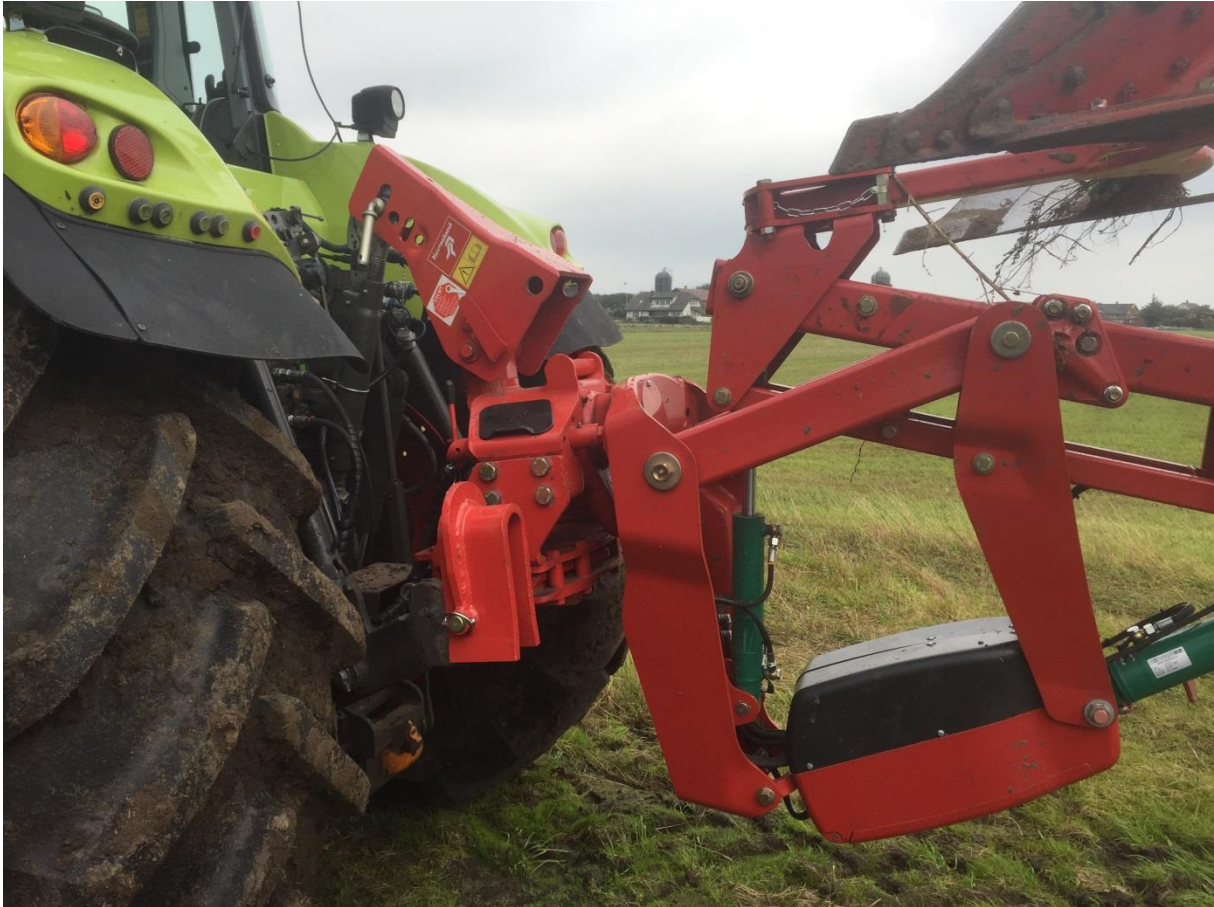
Kverneland 2500 i-Plough® Tête d'attelage articulée

Du transport au labour en un temps record