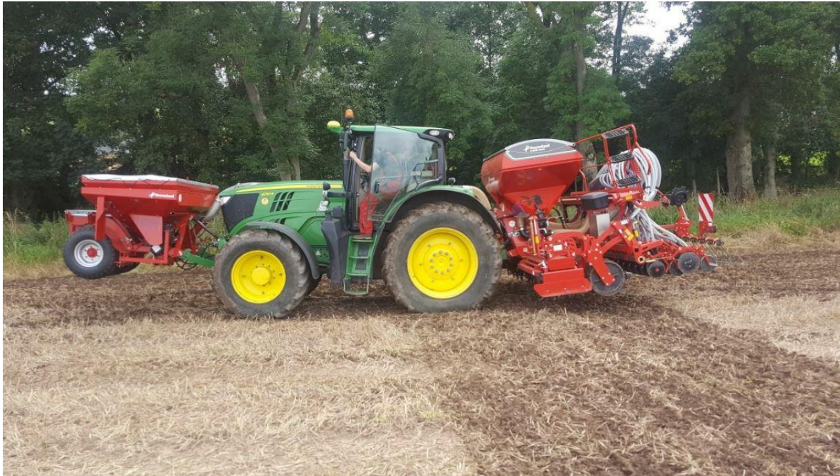
« Combiné de semis e-drill double cuve avec trémie frontale DF-1 et Cx II double entrée »

Afin d'augmenter sa polyvalence, le combiné de semis e-drill, lancé au SIMA 2017, évolue grâce à une nouvelle option « double cuve ».