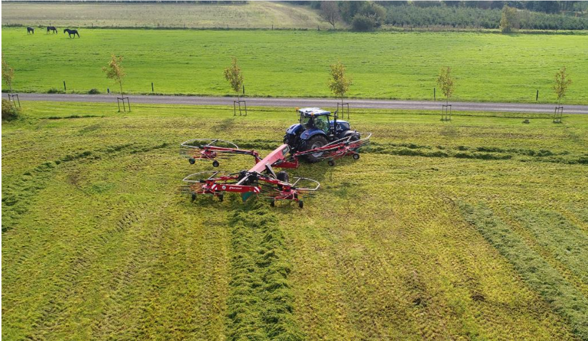
Relevage individuel des quatre rotors